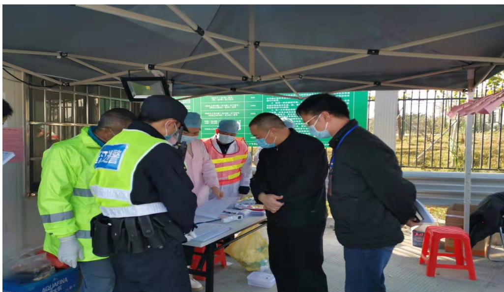
区领导督查高速口交通联合检疫站点防控工作

情况明。各有关单位要继续加大疫情宣传教育工作，确保将疫情防护知识传达到工地范围内每一个人。