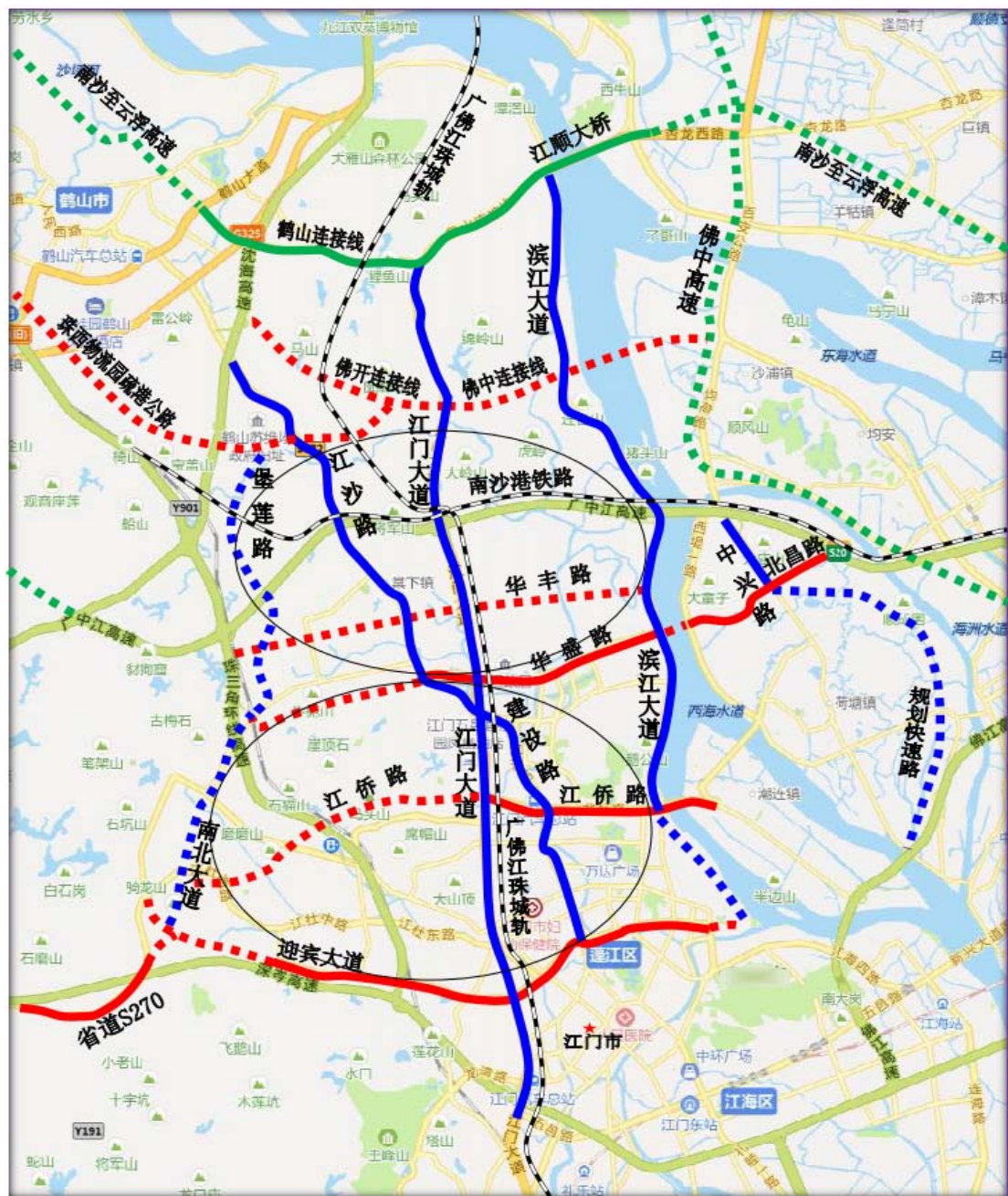
蓬江区“五横五纵两环”道路示意图

连接南北、贯通东西的轨道交通网络。积极配合江门市与广州、佛山、中山、珠海轨道交通合作，融入城际铁路、市域（郊）铁路发展，推动区域轨道交通一体化建设；配合建设珠江肇高铁和启动城市轨道交通1号线、2号线一期等相关铁路工程。