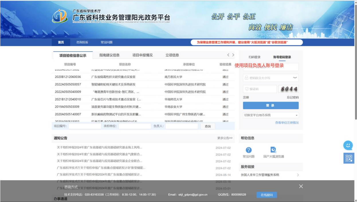
图2 广东省科技业务管理阳光政务平台系统登录界面

用项目负责人账号登录系统，“申报管理”-->“填写申请书”-->“新增项目申请”，选择“区域创新能力与支撑保障体系建设”>“工程中心认定”，填写申报信息。